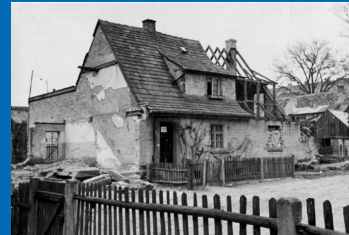
Im Zweiten Weltkrieg zerbombtes Haus